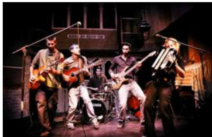
Les dessous de la vie, un groupe qui swing.

■ Y ALLER Nuit des musées à Guebwiller, au musée Deck, samedi 14 mai entre 20 h et 23 h, entrée gratuite.