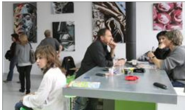
Les années passent, mais l'événement ne déroge pas à sa règle de convivialité.