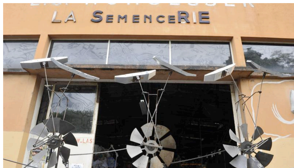
La façade de la Semencerie, agrémentée d'une installation métallique durant les Ateliers ouverts.

La Semencerie abrite, sous la charpente métallique d'un ancien entrepôt, quinze ateliers pour artistes « résidents permanents ». Il y a aussi des résidents