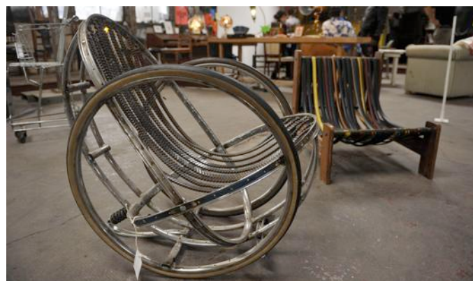
Un rocking-chair fabriqué à partir de chaînes et de roues de bicyclettes.

À l'entrée du lieu, Joseph Kieffer jette une longue rallonge au-dessus d'une poutre métallique pour alimenter une machine qui va propulser de la fumée vers l'extérieur. L'esprit de ce jeune homme compte de multiples tiroirs, contenant chacun des formes très diverses, variées. Il façonne aussi bien des crânes de métal que des sculptures en forme de bétonnières. Dans le « hall d'entrée », Adrien Grimaud ressemble à un savant fou, juché sur une plateforme métallique. Il manipule les commandes d'une forme vaguement arachnoïde, haute de près de trois mètres, qui se déplace très légèrement, de manière aléatoire. Adrien Grimaud crée des lampes et des sièges à partir de matériaux recyclés, fabriquant un rocking-chair à partir de roues de vélo ou un siège à partir d'une parabole métallique... Joseph et Adrien sont deux des artistes installés dans un provisoire qui dure depuis 2008.